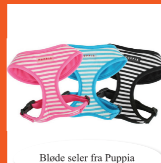
Bløde seler fra Puppia