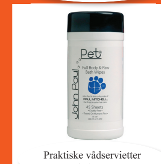
Praktiske vådservietter med aloe vera