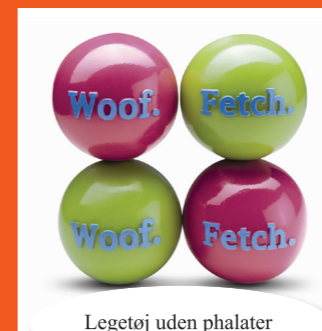
Legetøj uden phalater